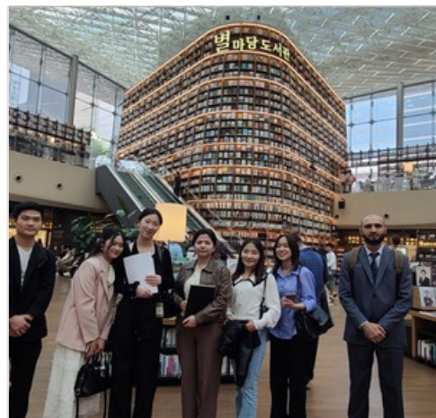
취업 박람회 갔다가!