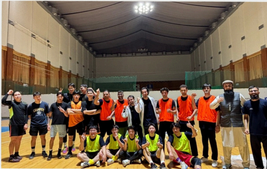
다들 너무 멋있어요!