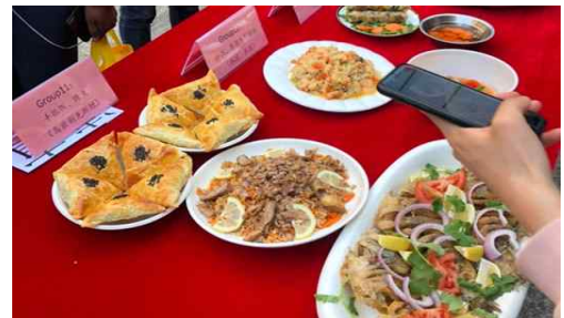
(세계 음식 대회)