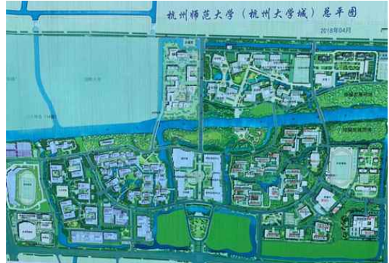
(항주 사범대학교 지도)