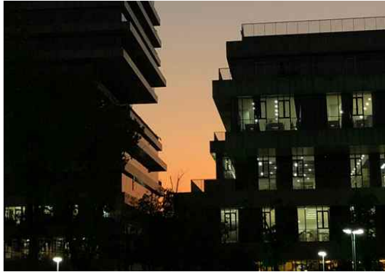
(항주 사범대학교 도서관)